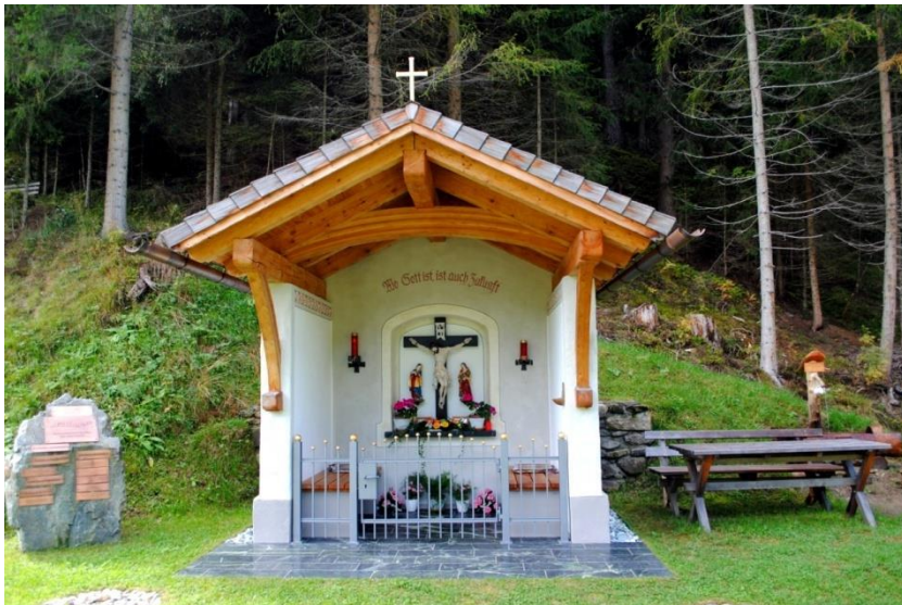
Gedenkstein mit Jahrestafeln Marterl mit Maria und Johannes, Elisabethbrunnen

In einer Power Point Präsentation konnten die Ausführungen des Obmannes in Bildern nachvollzogen werden.